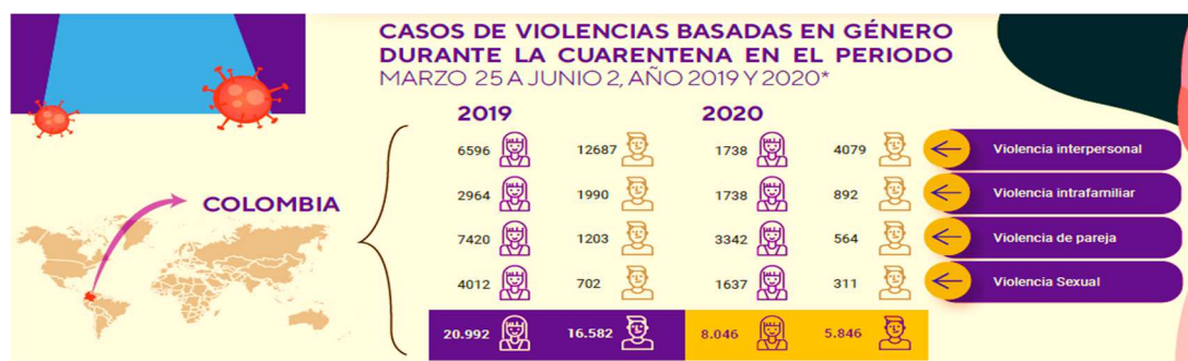
Figura 1: Casos de violencias basadas en género durante la cuarentena en el periodo de 25 mar. 2019 a 02 jun. 2020.