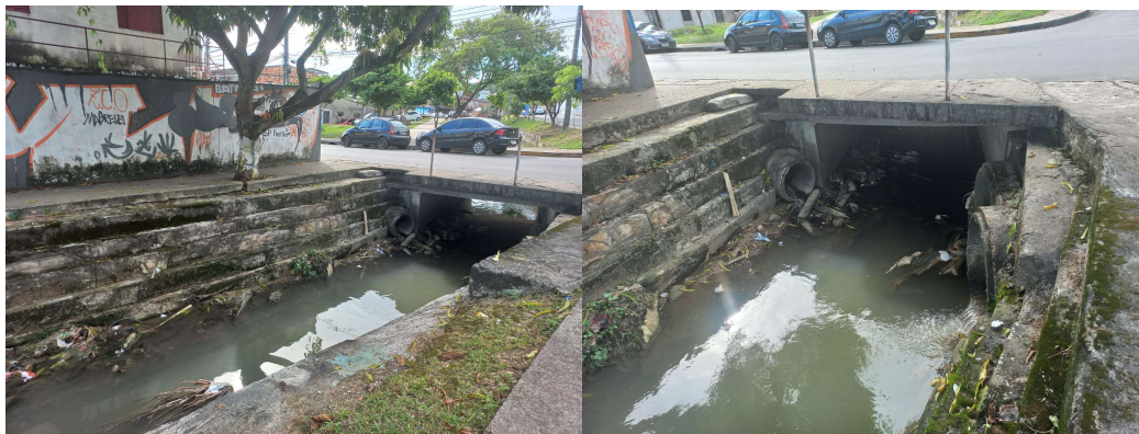
Figura 4: Situação do igarapé no trecho 2

Nos itens 10 e 11, referentes às soluções de melhoria do saneamento básico, todos os entrevistados responderam que a prefeitura realiza limpeza do igarapé de 6 em 6 meses e como melhoria poderiam colocar proteção de tela nos esgotos conforme figura 02 abaixo para não retornar à água para as casas em épocas de cheias, situação que impacta de forma direta ou indireta na vida dos moradores.