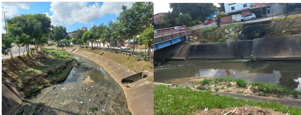
Figura 3: Situação do igarapé no trecho 1

encontra assoreado devido ao significativo banco de areia situado no canal, e com muitos resíduos descartados nas suas margens, além da queima destes, o que danifica a vegetação arbustiva responsável pela filtragem de materiais ao corpo d'água.